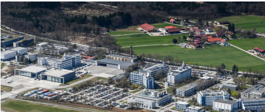
Der Standort Oberpfaffenhofen

Mit dem Zuschlag festigt STRABAG PFS seine Rolle als technischer Facility-Management-Dienstleister für anspruchsvolle und sicherheitsrelevante Infrastruktur.